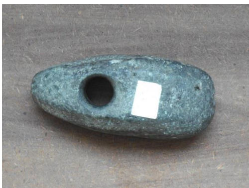
Каменны малаток (бронзавы век)

Фонды музея состоят из 437 экспонатов, в том числе 250 экземпляров экспонатов основного фонда, 187 - научно-вспомогательных экспонатов.