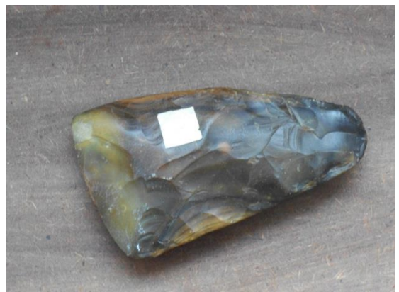
Каменны скрабак (рубiла)